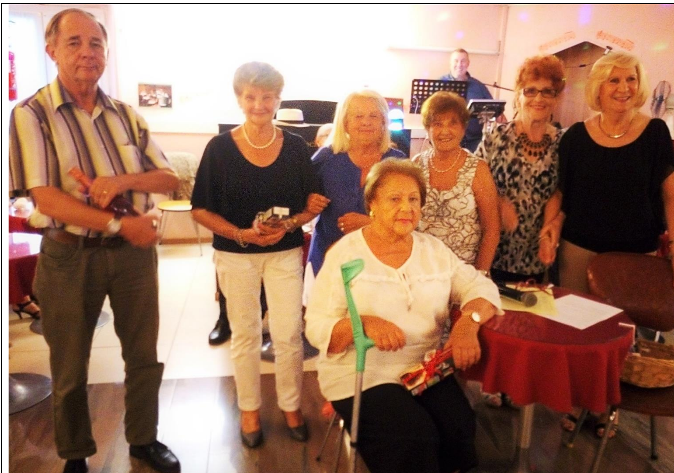
Et voici les natifs du mois de Septembre