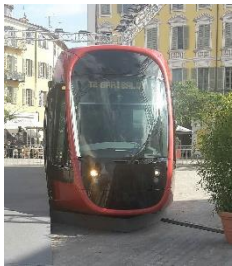
Très attendu ce tram