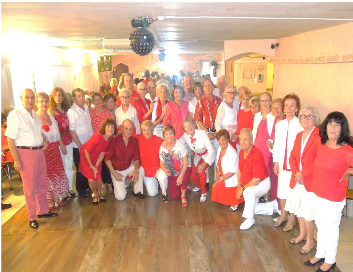
Journée rouge et blanc suivie par beaucoup d'adhérents : du piment dans la vie !