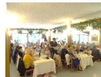
RIO DEL MOLINO