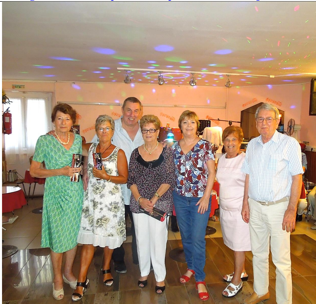
Les natifs du mois d'Août