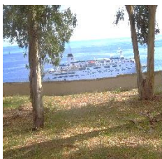
Le Berlin vu de la terre de Sicile