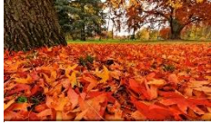
Feuilles d'automne et champignons