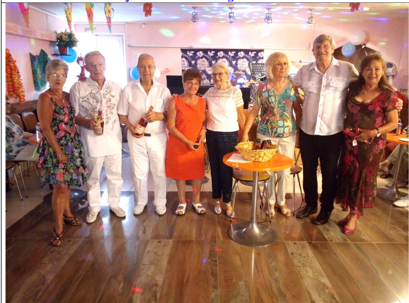
Ils sont nés en juillet