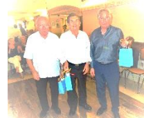
Les papys 2018