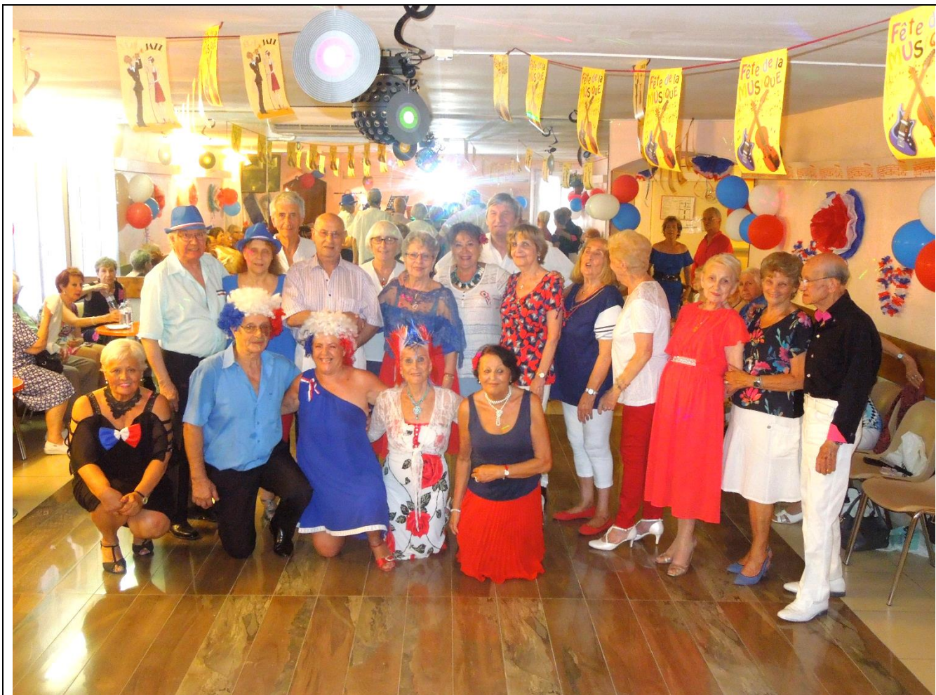
Un 14 juillet bleu blanc rouge autour de l'aïoli